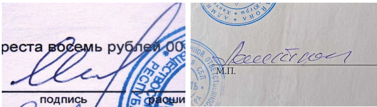
Rasm-1. erkin imzo namunalari.

Erkin namunalar bo'lib, xizmatga doir yozishmalarga tegishli matn va imzolar, tarjimai hol, o'z qo'li bilan to'ldirilgan so'rovnoma, ariza, shaxsiy xat, konspekt, shartnoma, nafaqa yig'ma jildi, ish joyidagi shaxsiy yig'ma jild, to'lov vedomost, kassa orderi va boshqa hujjatlardagi imzolar tushunilishi mumkin.